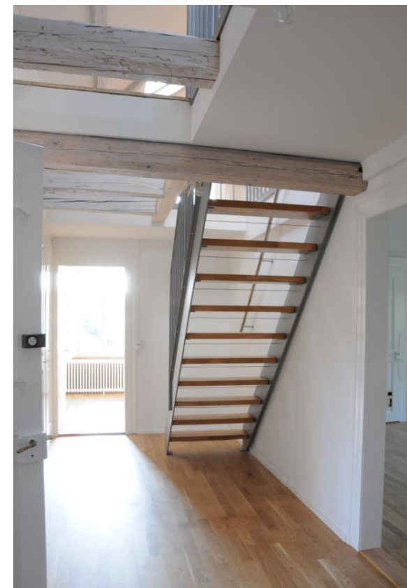
Treppenaufgang ins Dachgeschoss