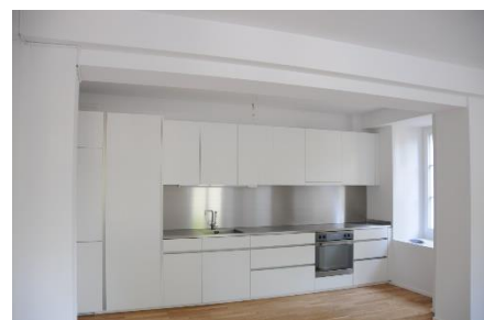
Küche im 1. Obergeschoss