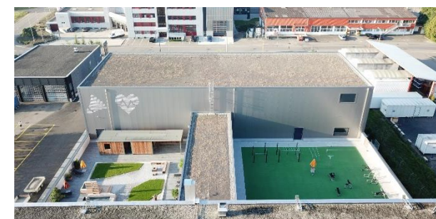
Übersicht Aussenbereich Fitness Loge

Um während der ganzen Bauzeit den umliegenden Mietern immer genügend Parkplätze anbieten zu können, wurde der ganze Bauablauf komplett umgedreht. So wurde zuerst mit der Umgebung, den Parkplätzen, der Kanalisation und dem Zusammenschluss mit der Strasse begonnen. Erst in der zweiten Phase wurde der Neubau erstellt.