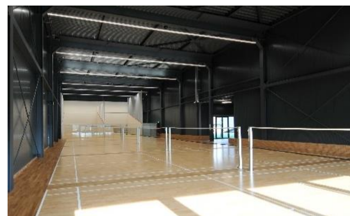
Badmintonhalle mit Squash-Kabinen