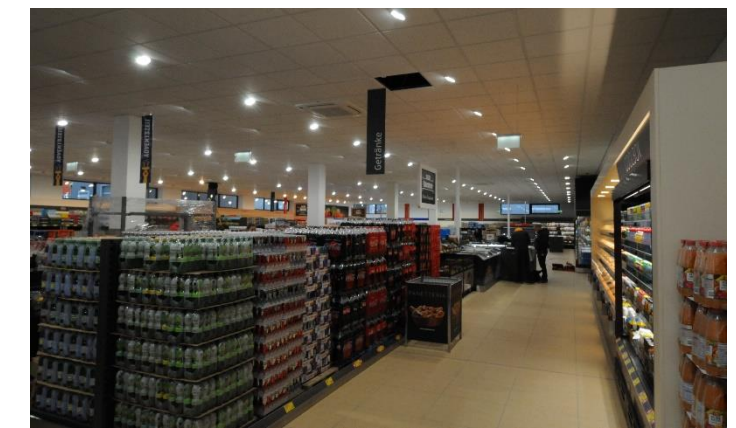
Innenansicht Grossverteiler - Aldi