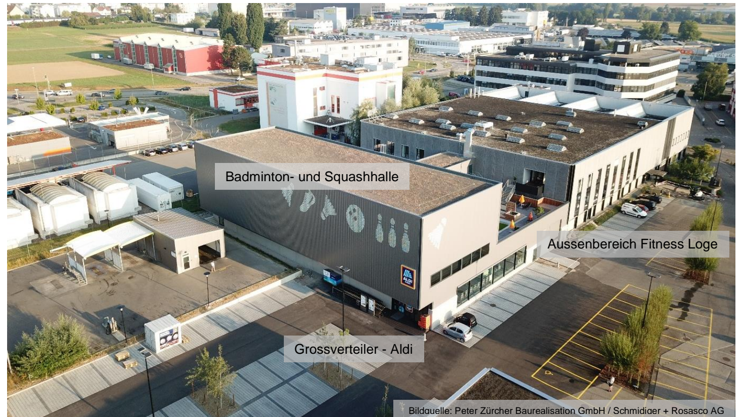
Gesamtsituation des Neubaus